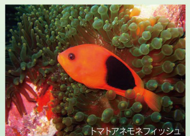
トマトアネモネフィッシュ